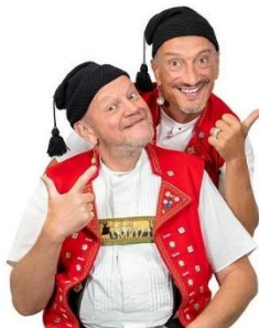
Messer & Gabel